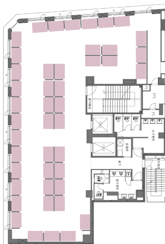
↑中西ビル 小ブース 45 社