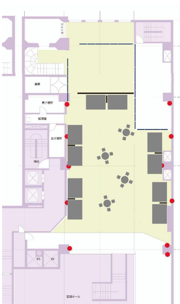
↑田源ビル 中ブース 10 社